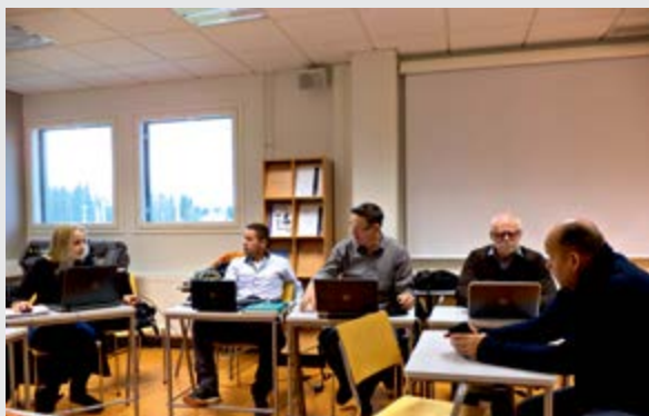
Erasmus fólk spjallar í Finnlandi

IÐAN tekur þátt í ýmsum Erasmus verkefnum. Samstarfsverkefnum á sviði starfsmenntunar er ætlað að styðja við og auka gæði starfsmenntunar í Evrópu. Styrkt verkefni þurfa sömuleiðis að styðja við evrópsk stefnumið í starfsmenntun um að auka gæði