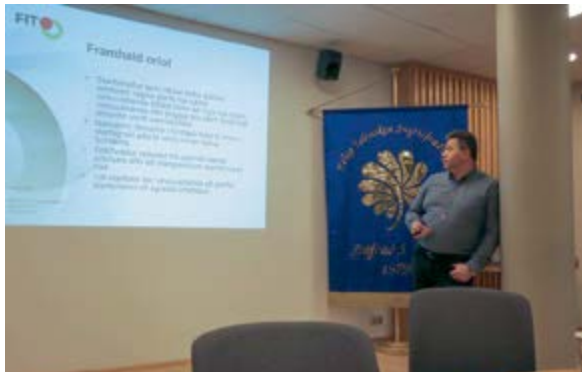
Hilmar formaður kynrir samning snyrtifræðinga

Nefndin skal tilkynna fyrir lok febrúar 2017 hvort sú forsenda hafi staðist.