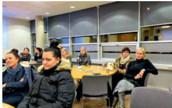
Snyrtifræðingar á kynningarfundum