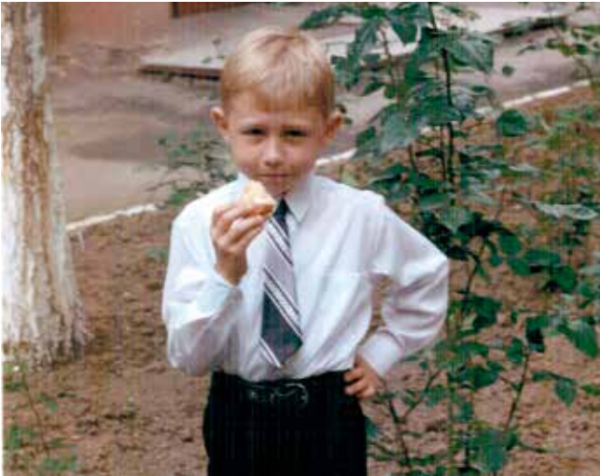
Mynd tekin af mér 6 ára við útskrift úr leikskólanum.

jafnvel án þess að kunna tungumálið. Fólk í Úkraínu heimsækir t.d. oft kirkjuna sína og þá sérstaklega um páska og flestir aðhyllast Rétrún-aðarkirkjuna (Orthodox) og þar er mikil trúarhefð. „Það er mikill munur á Íslandi og Úkraínu, þar er t.d. töluð Úkraínska, en í austurhlutanum talar fólk einnig rússnesku. Þegar ég var í skóla fékk ég til dæmis tækifæri til að læra rússnesku líka“