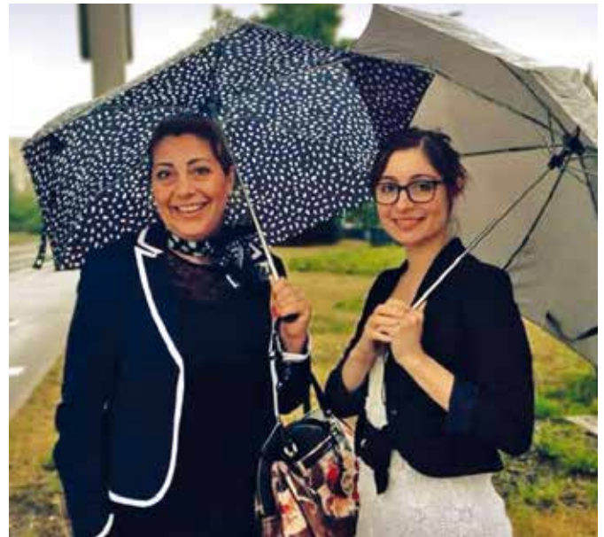
Ég og mamma í sumarfrí í Pólandi 2013.

Það var ekki hægt að stoppa að ræða um skrúðgarðyrkjuna og okkur langaði að forvitnast um hvað þýðingu það muni hafa fyrir hana þegar hún klárar að verða sveinn í skrúðgarðyrkju. „Vá, góð spurning. Það þýðir að ég gat þetta! Blóð, sviti og tár. Haha. Nei, en svona spauglaust þá þýðir það að ég get kallað mig Skrúðgarðyrkjufraeðing. Það þýðir að ég er búin að læra skrúðgarðyrkju og veit hvað ég syng, þó maður sé nú alltaf að læra meira og bæta við sig þekkingu, allt sitt líf. Það þýðir að draumurinn minn rættist, ég hef meiri skilning á þessu græna, gráa og öllu þar í kring auk þess sem að fleiri dyr hafa opnast.“ En í framtíðinni, hvar sérðu þig eftir 10 ár. „Kannski verð ég áfram í minni núverandi vinnu, kannski fer ég að læra landslagsarkitektúr eða læt annan draum rætast og fer að hanna og búa til náttúruleg leiksvæði fyrir börn eða hlaða torf. Kannski næ ég að blanda saman listum, sköp-