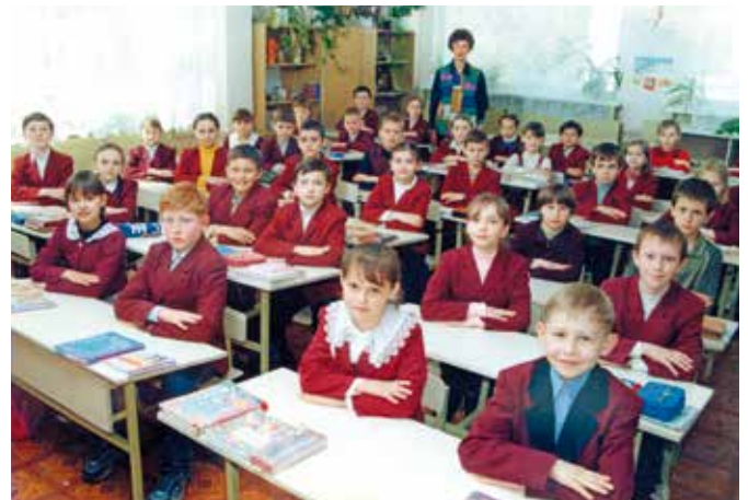
Ég er þarna fremstur á myndinni í 1. bekk. Öll 33 í skólábúningum stillt, þrúð og agi frá byrjun.